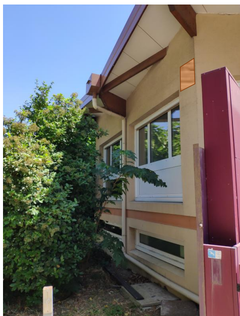
Figure 7 : Localisation nichoir 1