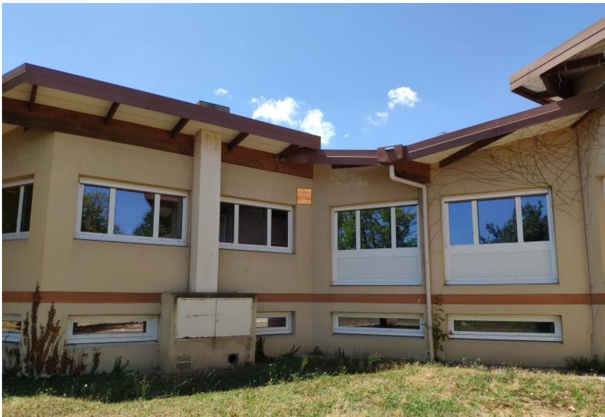
Figure 9 : Localisation nichoir 4