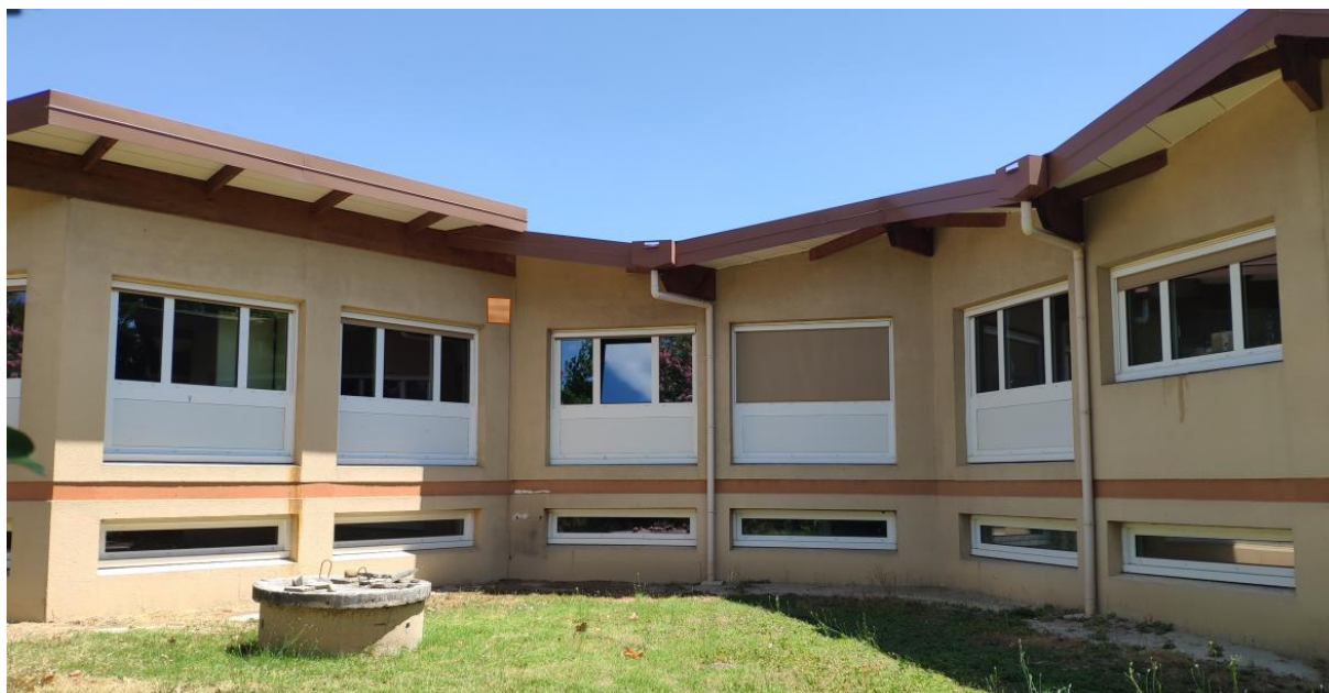
Figure 13 : Localisation nichoir 9