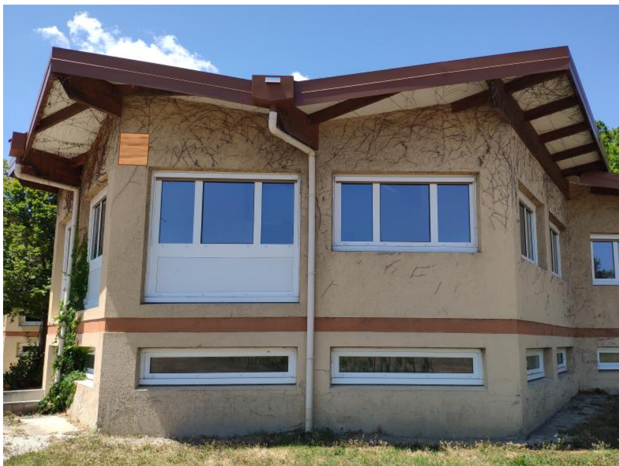
Figure 8 : Localisation nichoir 3