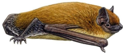
Figure 1 : Pipistrelle de Kuhl taille réelle

Toutes les espèces de chauves-souris métropolitaines sont protégées et insectivores, mais chaque espèce a un régime alimentaire spécifique. Une Pipistrelle de Kuhl pèse entre 5 et 10g et mange l'équivalent de 1/3 de son propre poids chaque nuit en insectes. (Équivalent en poids à 3 000 moustiques par nuit)