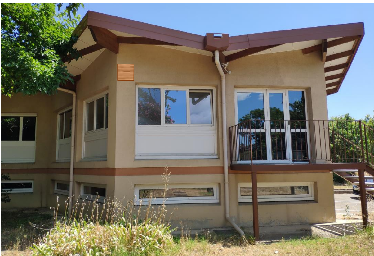
Figure 12 : Localisation nichoir 8