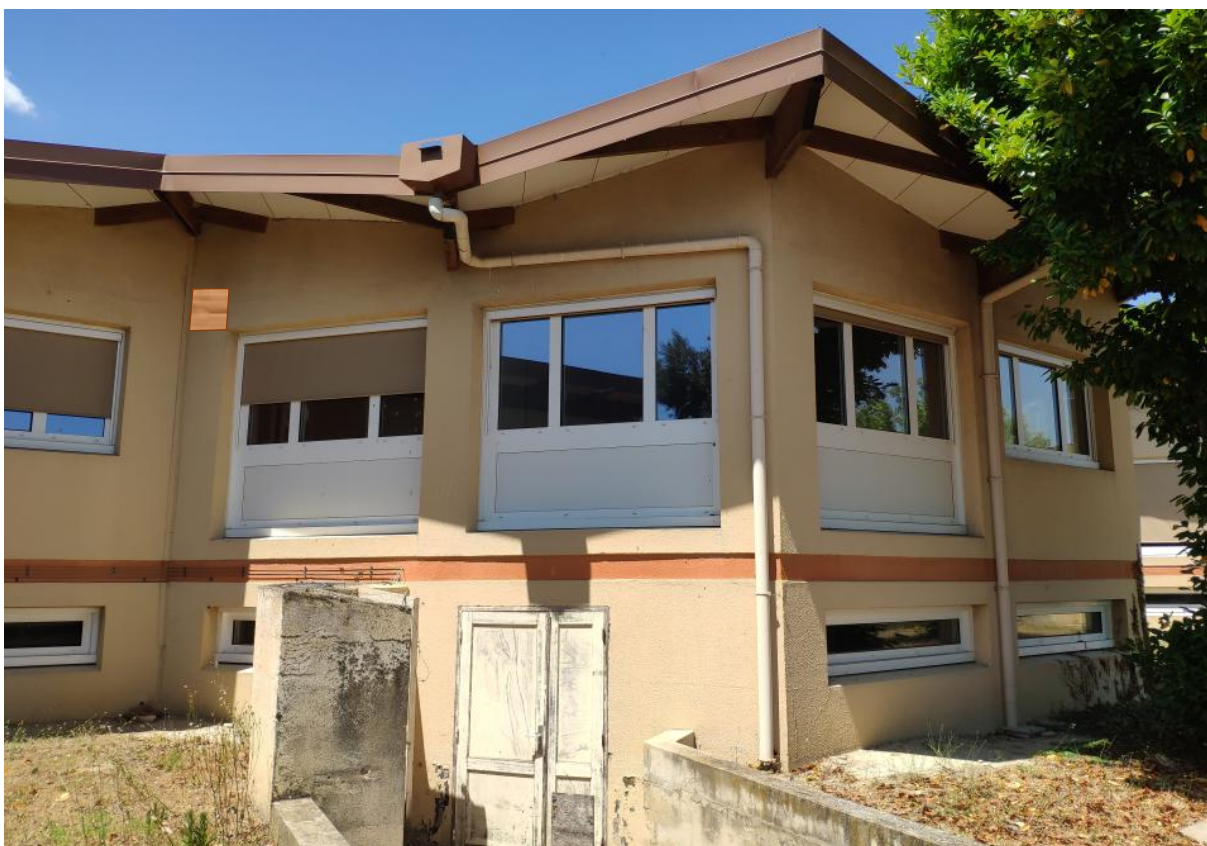
Figure 10 : Localisation nichoir 5