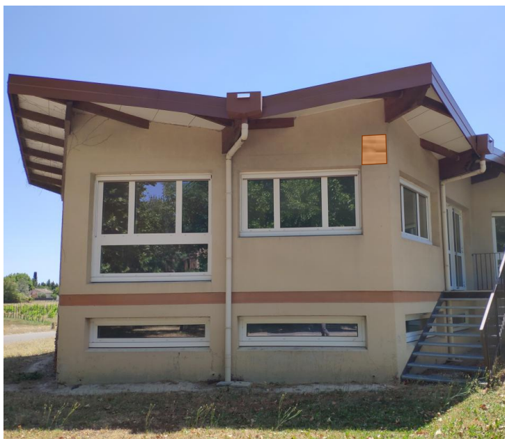
Figure 6 : Localisation nichoir 2