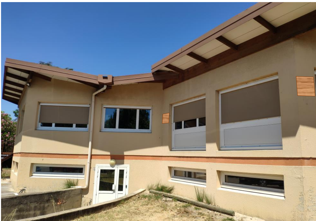
Figure 11 : Localisation nichoir 6 (à droite) et 7 (à gauche)