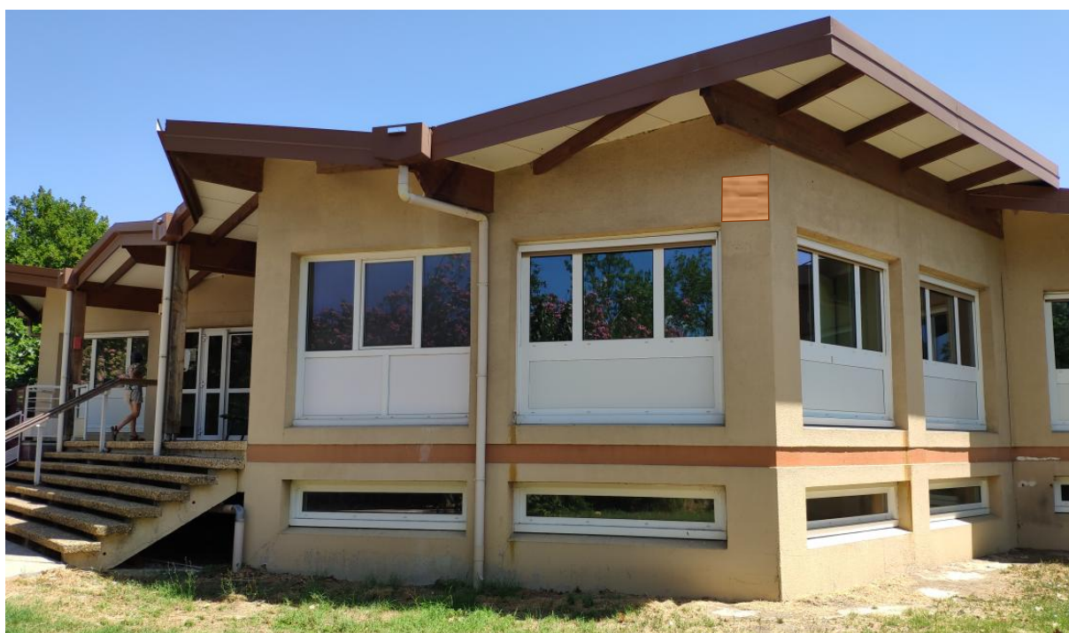
Figure 14 : Localisation nichoir 10